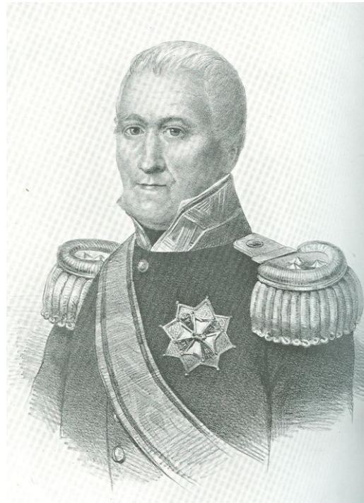
Luitenant-Generaal Krayenhoff 1758-1840

Om zijn plannen te verwezenlijken, stelde koning Willem I luitenant-generaal Krayenhoff aan. In oktober 1824 besprak de koning de defensie van Curaçao met Krayenhoff en op 26 november bracht Krayenhoff rapport uit waarin hij de bouw van buiten-